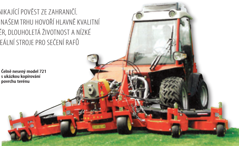
Čelně nesený model 721 s ukázkou kopírování povrchu terénu

s vlastní pohonnou jednotkou. U většiny sekaček z nabízeného sortimentu lze nastavit výšku sečení od 25 do 120 mm. Pohon všech rotorových jednotek je zajištěn od vývodového hřídele přes kuželovou převodovku a patentované řemenové převody.